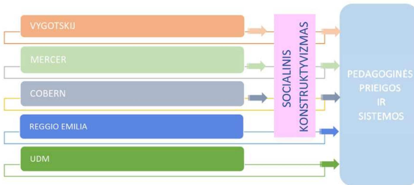
1 pav. Integruota teorinė programos prieiga

Programa yra grindžiama integruota teorine prieiga, kuri sujungia socialinį konstruktyvizmą ir „ Regio Emilija “ pedagogikos principus. Vaikas mokosi aktyviai – patiriant, tyrinėjant, eksperimentuojant, sprendžiant problemas. Vaikas laikomas smalsiu, aktyviu, kūrybingu, nuolat sąveikaujančiu (su draugais ir suaugusiais) ugdymo proceso dalyviu. Mokymas(is) vyksta žaidžiant, atliekant grupines veiklas. Artimiausia vystymosi / raidos erdvė – vaikui padeda įveikti sudėtingesnes užduotis su suaugusiųjų ar kito vaiko pagalba. Vaiko žinios ir gebėjimai konstruojami pamažu, naują patirtį prijungiant prie jau turimos patirties ar žinių, taip vaikas susikuria savo prasmę. Didelis dėmesys skiriamas aplinkai kaip galimybei ją stebėti, išbandyti naujas idėjas, daryti skirtingus dalykus ir tikrinti rezultatus. Svarbus veiksnys – tėvų įtraukimas ir išitraukimas į ugdymo(si) procesą. Siekiant besimokančiųjų įvairovės pažinimo, įgyvendinant įtraukųjį ugdymą, pasirinkta universalus dizaino mokymuisi prieiga. Organizuoti universalus dizaino principais paremtą ugdymo procesą padeda moksliniais įrodymais grįstos UDM gairės (integruotos teorinės prieigos paaiškinimas 1 pav.)