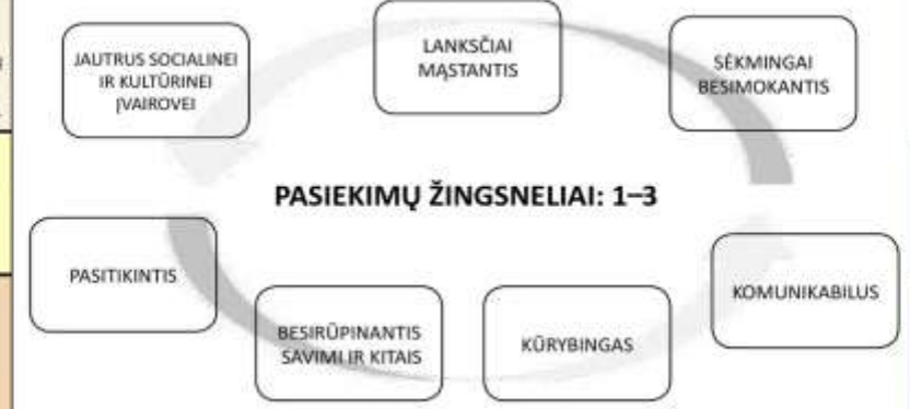
4 pav. Pasiekimų žingsneliai: 1–3