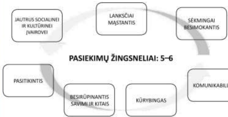
6 pav. Pasiekimų žingsneliai 5–6