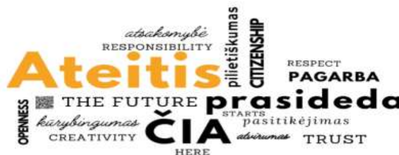
2 pav. Filosofija ir vertybės

Vaiko ugdymasis grindžiamas požiūrio į vaiką ir jo ugdymą(si) sąlygotomis vertybėmis, dėl kurių susitarta Mokyklos-darželio bendruomenėje, siekiant įgyvendinti Mokyklos-darželio filosofiją – ATEITIS PRASIDEDA ČIA.